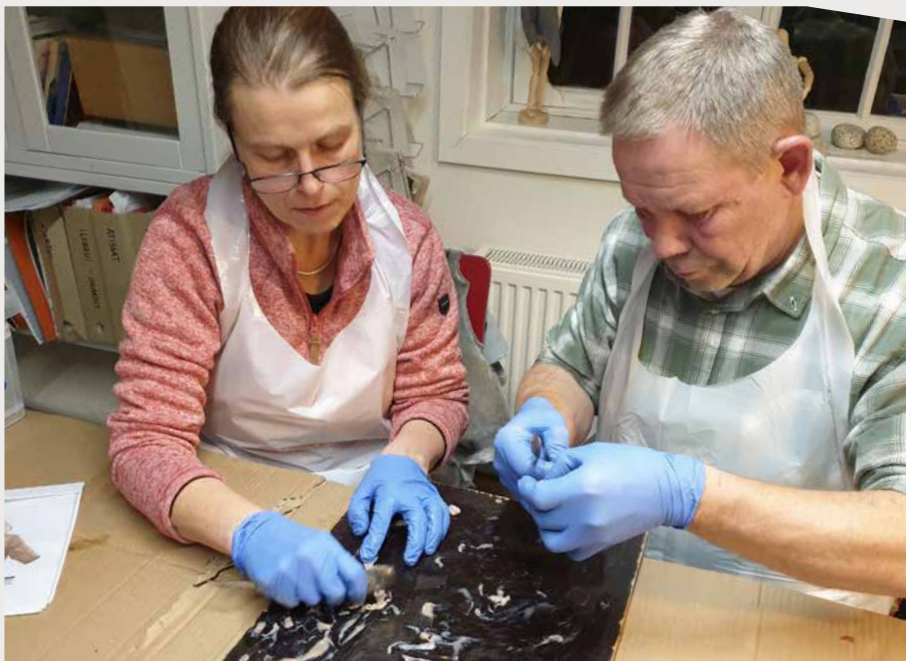
Ø. Ilulissat Kunstmuseum / Kunstnermøde / Grønland /2021 N. Qasigianniguit Museum / Drop ind workshop / Grønland /2021