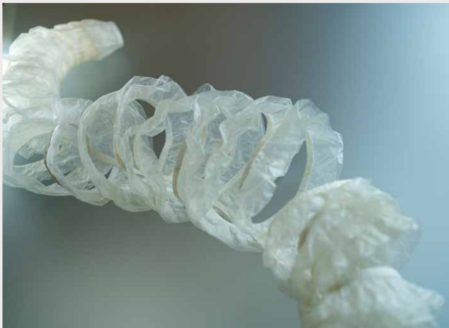
Ø.: Tarmskindsparka, 1924, Vestgrønland. N.: 'Laaangt Åndehul' af Julie Bach, 2020. Materiale: Svinetarm og gedehud.